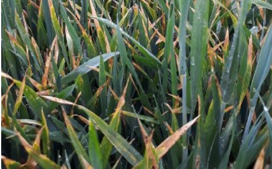
Billede 3. Frostskadet vinterhvede fotograferet 22. maj 2019 af Jens Larsen, VKST. Samme symptomer som på billede 1.