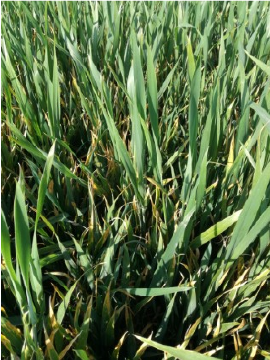
Billede 1. Frostskadet vinterhvede fotograferet 20. maj 2019 af Leo Bajlum, Vestjysk. De frostskadede skud er holdt op med at vokse. I denne mark er de lave planter også blevet usædvanlig hårdt angrebet af Septoria.