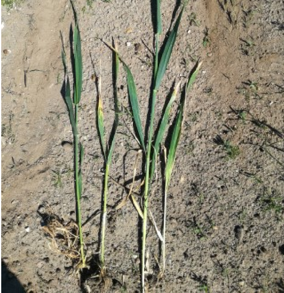
Billede 2. Nærbillede af billede 1 fotograferet 20. maj 2019 af Leo Bajlum, Vestjysk. Bemærk de lave skud med gule hjerteskid.