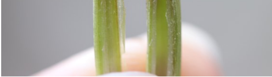
Billede 5. Flækkes skuddene med de døde hjertesud, ses på nogle af planterne mørke misfarvninger. Foto fra 16. maj 2019.