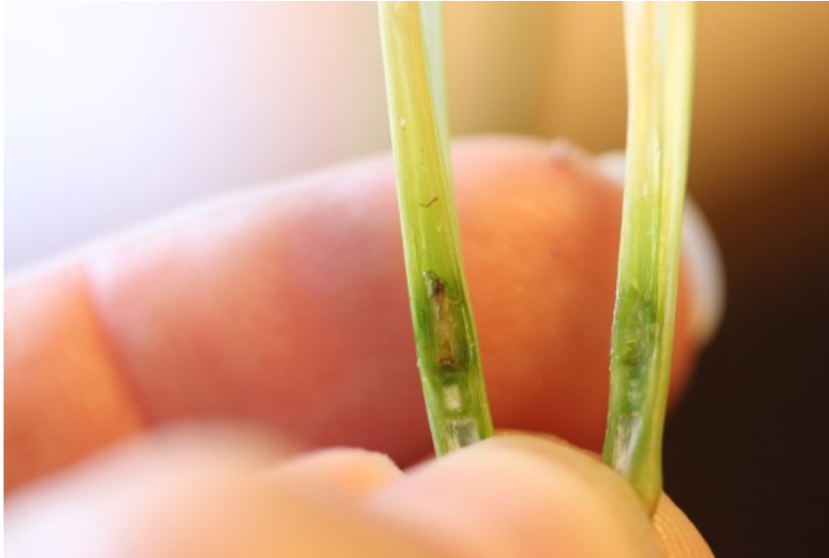
Billede 6. Flækkes skuddene med de døde hjertesud, ses på nogle af planterne mørke rester af aksanlægge. Foto fra 16. maj 2019.