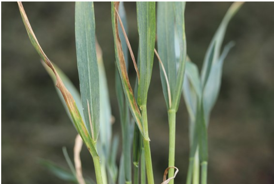
Billede 4. Nærbillede af visne hjertereskud på frostskadet hvede fotograferet 16. maj 2019.